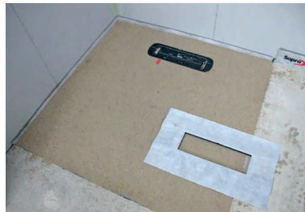
DallFlex Dichtmanschette – Bereit zum Einbau mit Sopro Abdichtungssystem