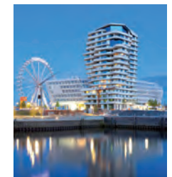
Marco Polo Tower, Hamburg, Architekt: Behnisch, Stuttgart