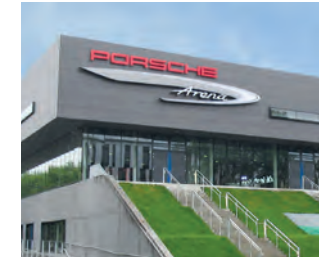
Porsche Arena, Stuttgart Architekt: asp, Stuttgart