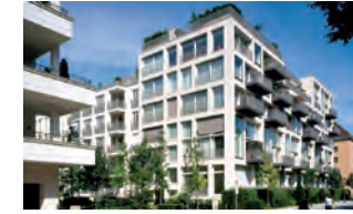
Lenbach Gärten, München Architekt: Otto Steidle, München