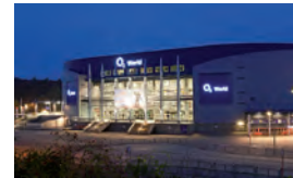
O2 World, Hamburg Architekt: JSK, Frankfurt/Main