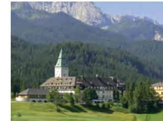
Schloss Elmau, Krün Architekt: Hilmer Sattler, München