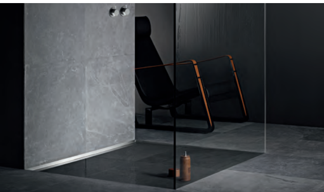
Duschrinne CeraWall Select für bodengleiche Duschen

Die Marke Sopro steht für innovative Produkte und Produktsysteme rund um die Gewerke Fliesenverlegung, Estricharbeiten, Putz- und Spachtelarbeiten, Abdichtungsarbeiten, Mauerwerksbau sowie Garten- und Landschaftsbau. Die Sopro Produkte zeichnen sich durch einfache Verarbeitung, Langlebigkeit und eine dauerhafte Belastbarkeit aus.