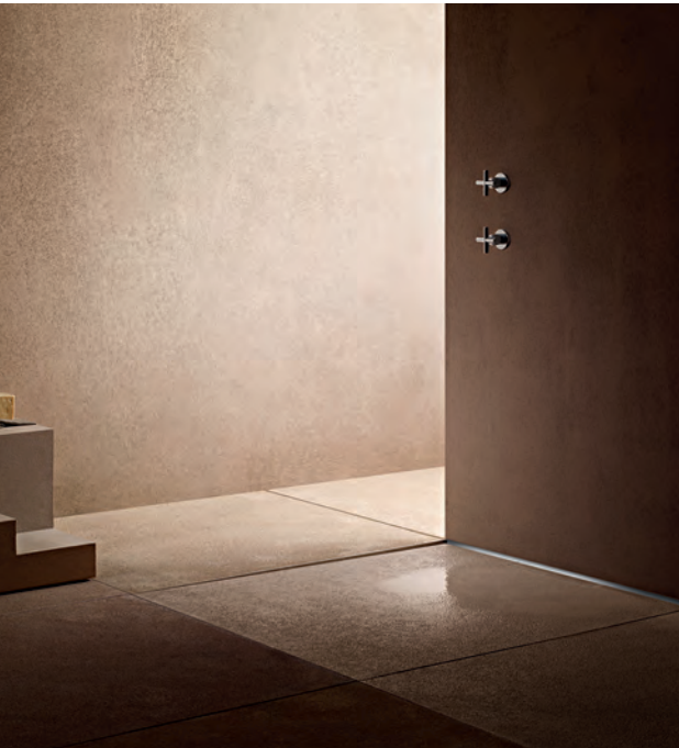
Duschrinne CeraWall Individual für bodengleiche Duschen

Unter dem Thema „Bodengleiche Duschen – vom Ablauf bis zur Fliese“ werden in dieser Veranstaltung die aktuellen Normen, der Stand der Technik, Optionen für Brand- und Schallschutz sowie innovative Bauprodukte vorgestellt. Besondere Aufmerksamkeit erhalten dabei die spezifischen Bodenaufbauten, Ablaufsysteme und Abdichtungen sowie die Gestaltung barrierefreier Bäder. Nutzen Sie unser Know-how für Ihren Service beim Kunden.