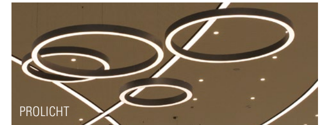
My City Centre Masdar, Abu Dhabi Architekten: M/s. KEO International Consultants