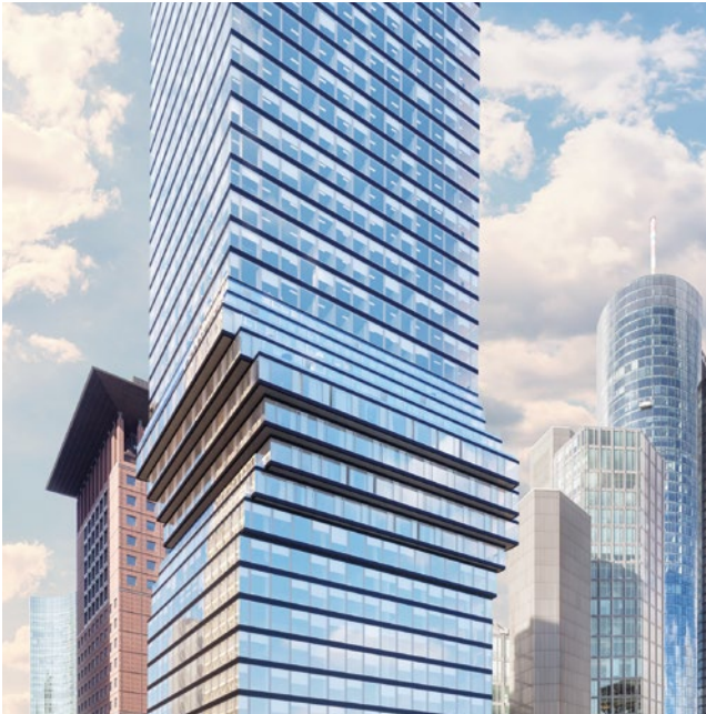
Omniturm, Frankfurt / Main Architekten: BIG | Bjarke Ingels Group, Kopenhagen