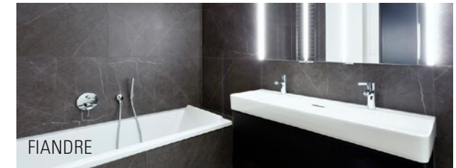
Omniturm, Frankfurt / Main, Architekten: BIG | Bjarke Ingels Group, Kopenhagen